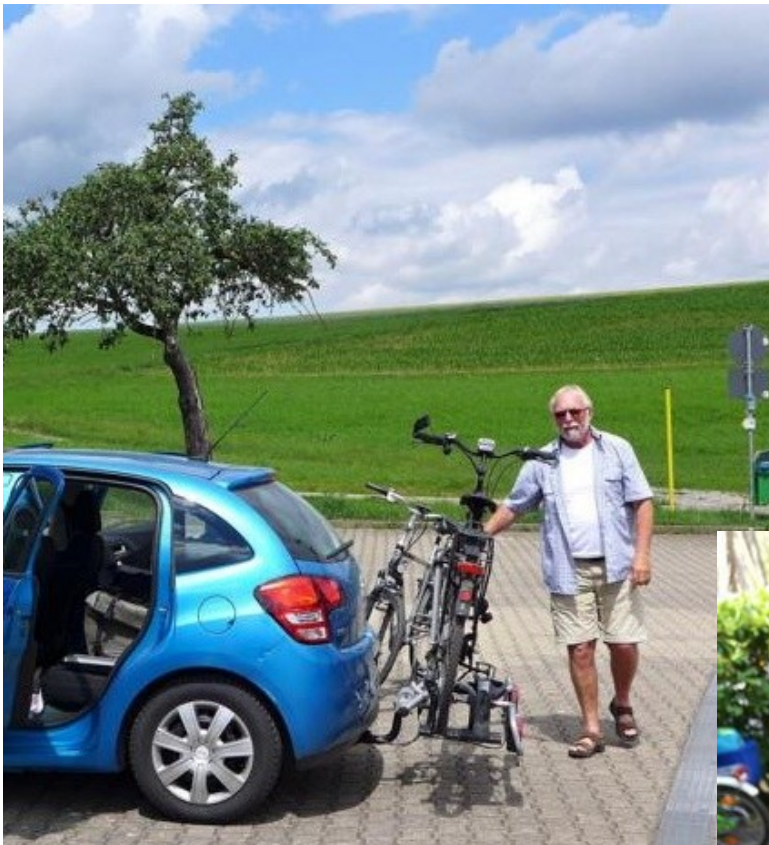
Fahrradausflug im Naturpark Schwäbisch Fränkischer Wald.