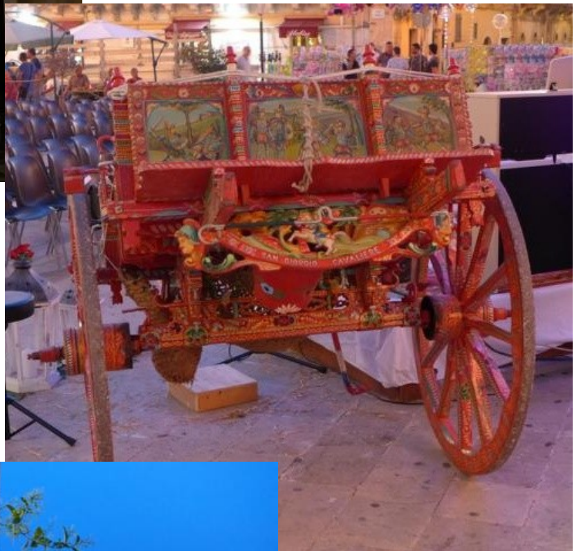
Historischer Maultierwagen liebervoll verziert.