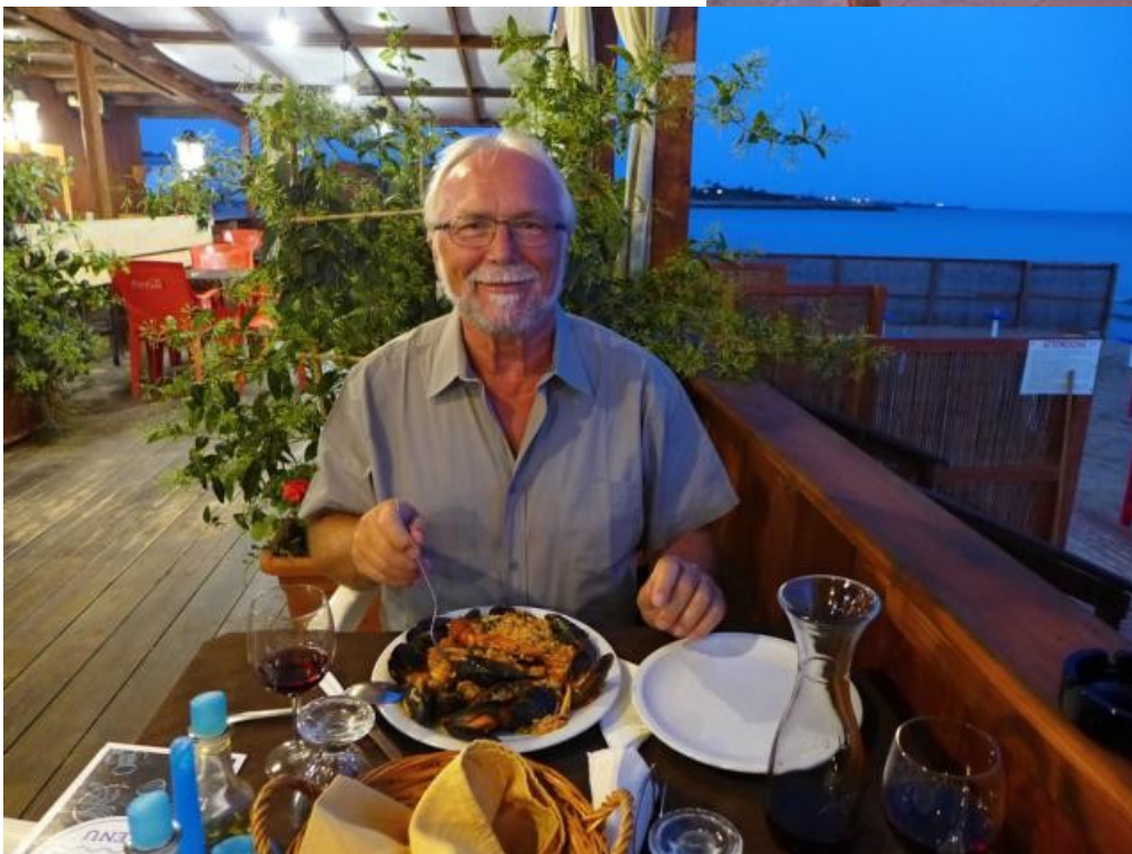
Frutti di Mare im Strand- restaurant in Punta Braccetto.