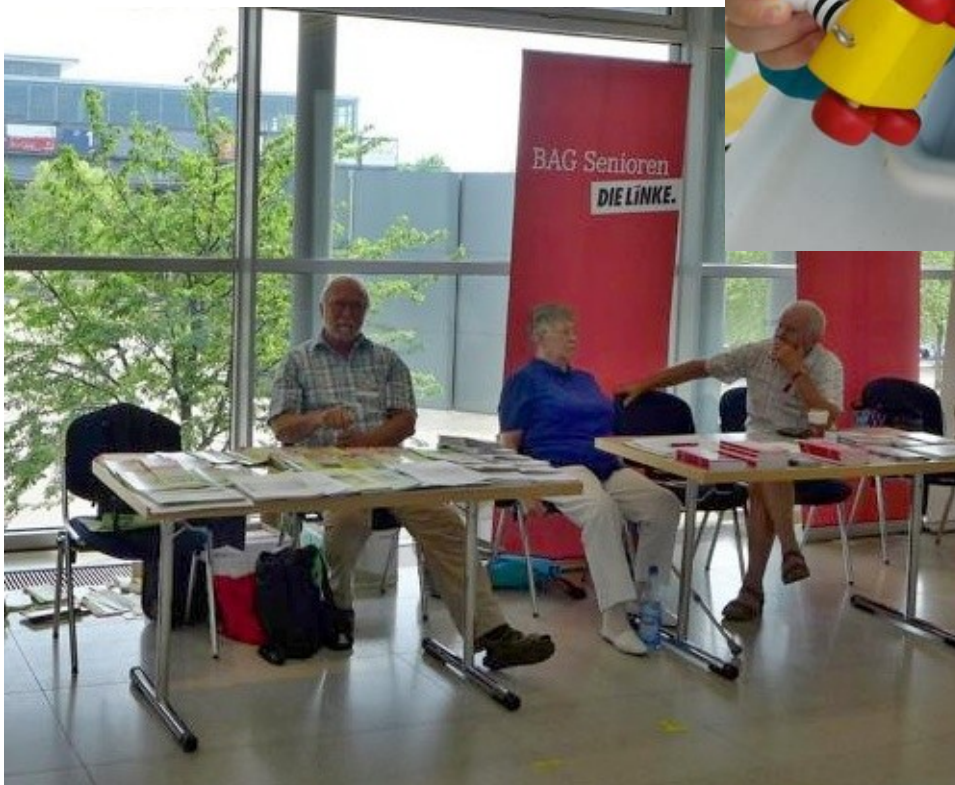
Juni Reinhard auf dem Parteitag der LINKEN in Leipzig.