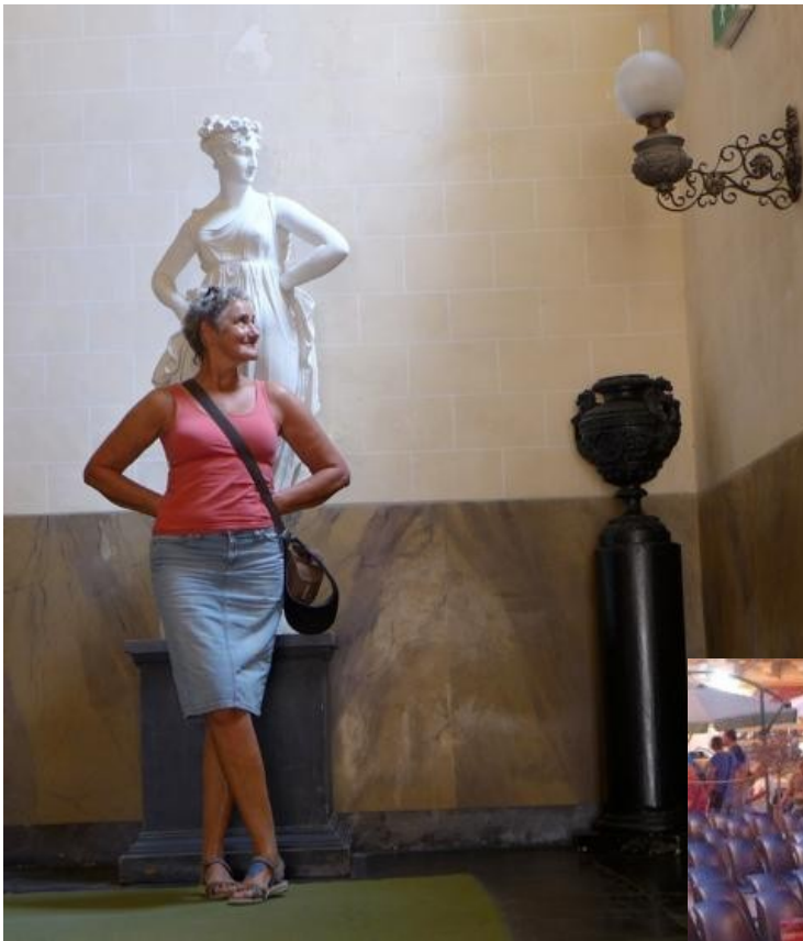
Zwei Grazien im Treppenhaus der Villa Donna Fugata auf Sizilien.